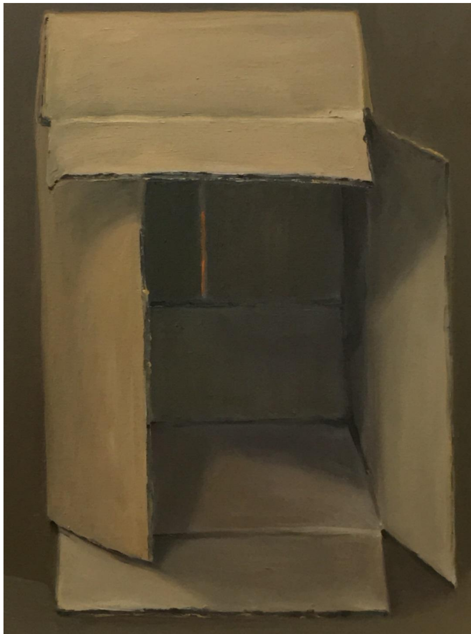
Liliana Alves, abas abertas , 2016, óleo sobre tela, 40 x30 cm.