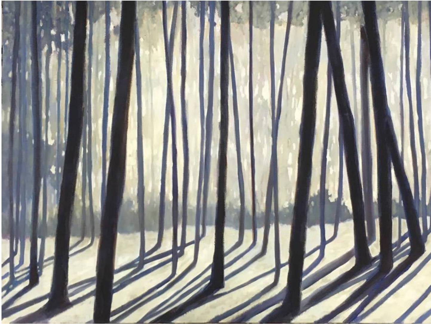
Liliana Alves, floresta , 2011, óleo sobre tela, 80 x 100 cm.