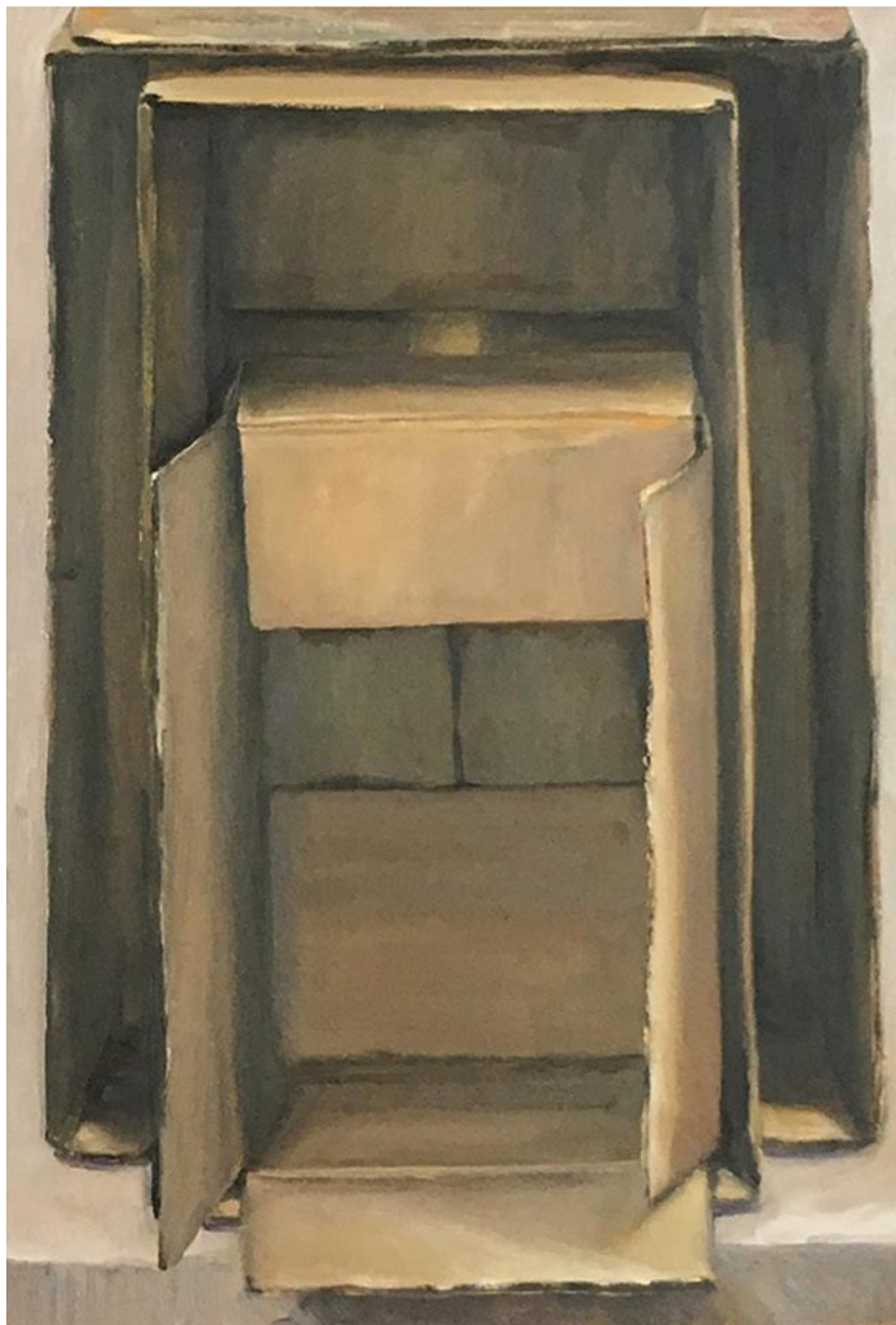
Liliana Alves, encaixadas , 2016, óleo sobre papelão, 50 x 35 cm.