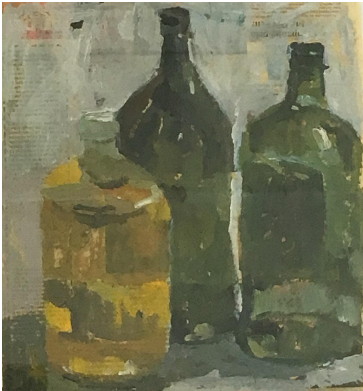
Liliana Alves, garrafas coloridas , 2010, óleo sobre jornal, 34 x 31 cm.