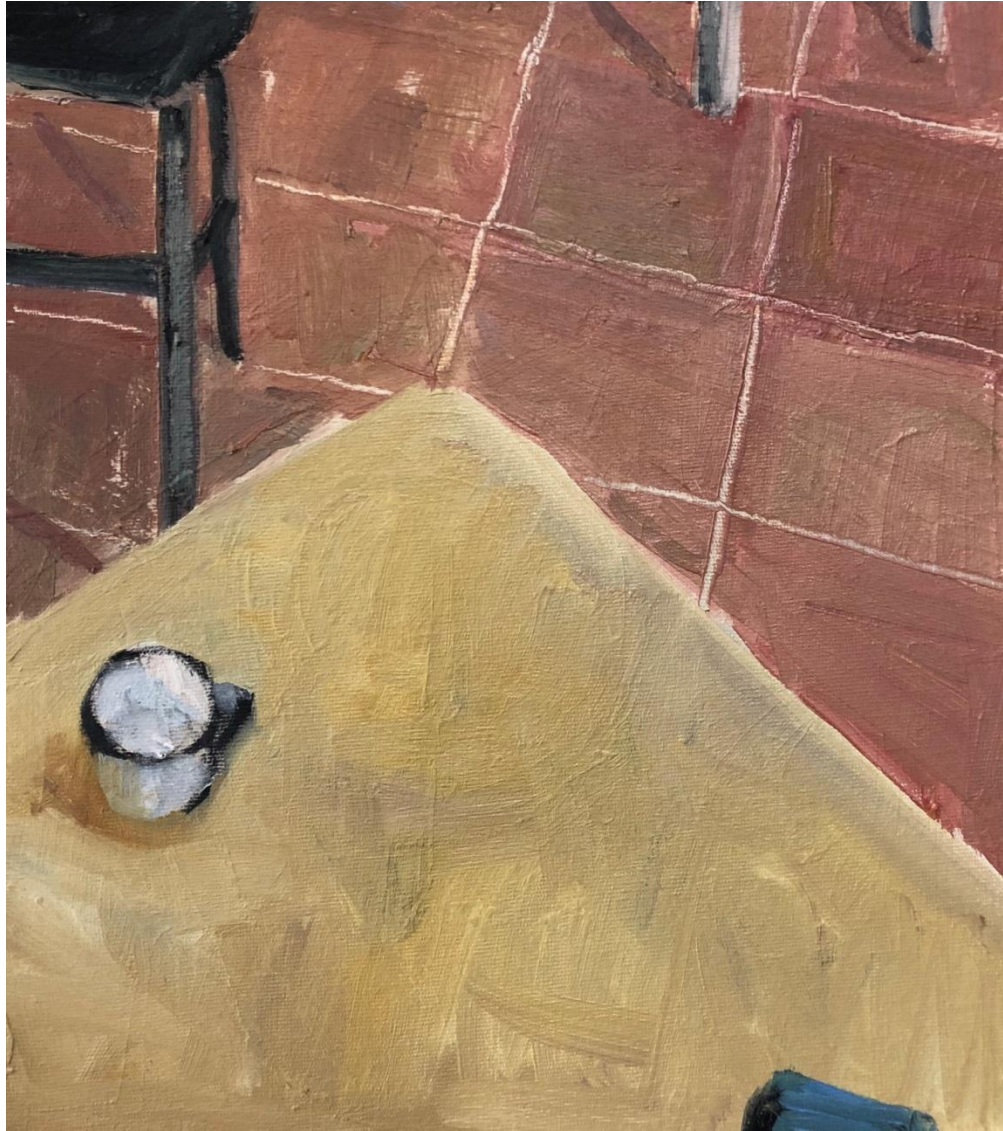
Liliana Alves, cheguei cedo , 2020, óleo sobre tela, 30 x 27 cm.