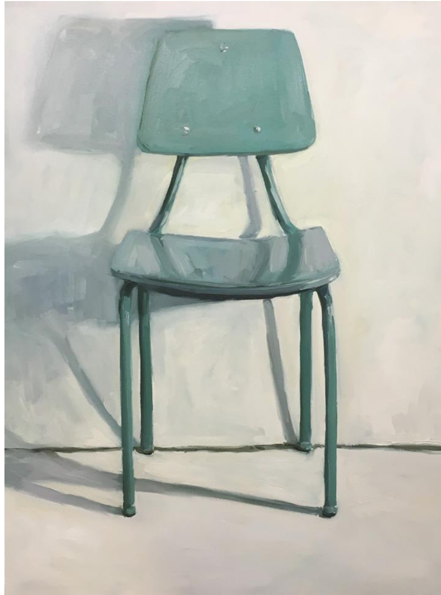
Liliana Alves, ausência , 2016, óleo sobre tela, 90 x 70 cm.