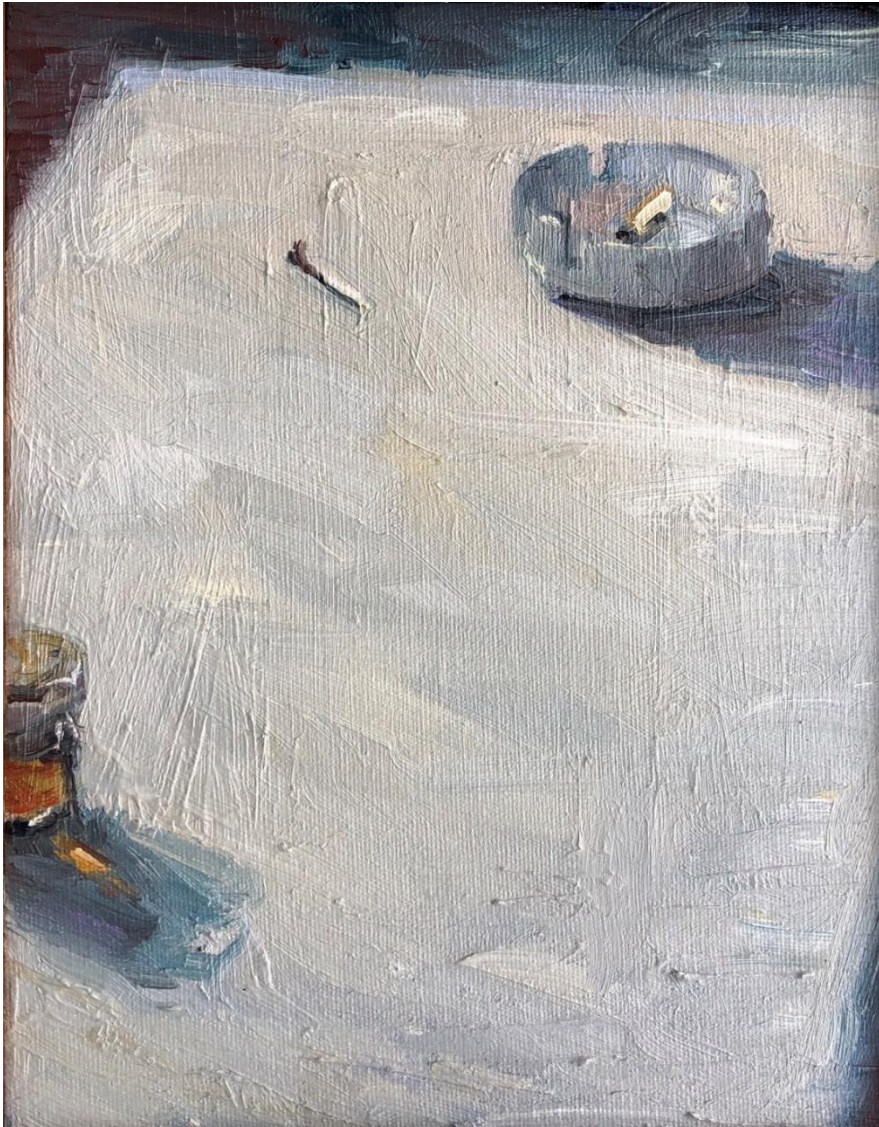
Liliana Alves, sem título , 2019, óleo sobre tela, 24 x 19 cm.