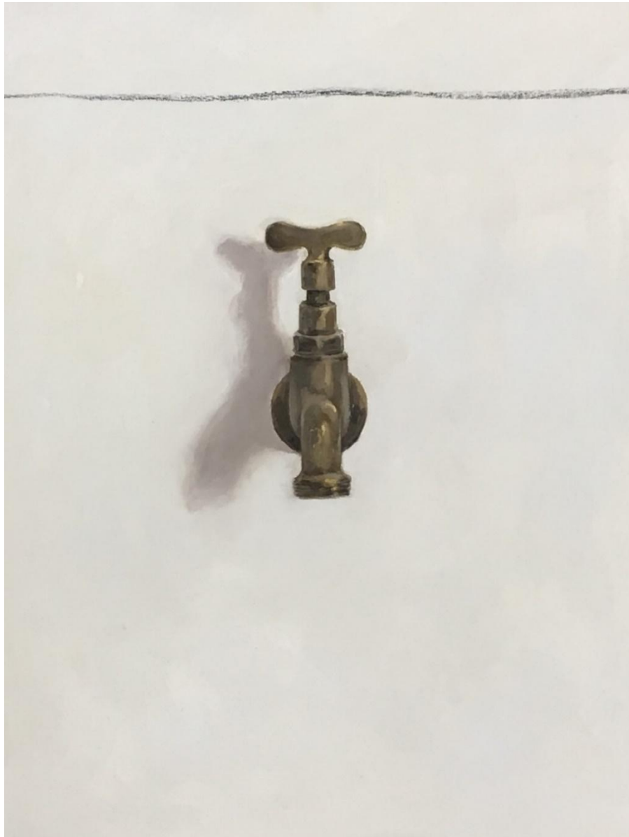
Liliana Alves, secura , 2016, óleo e carvão sobre tela, 40 x 30 cm.