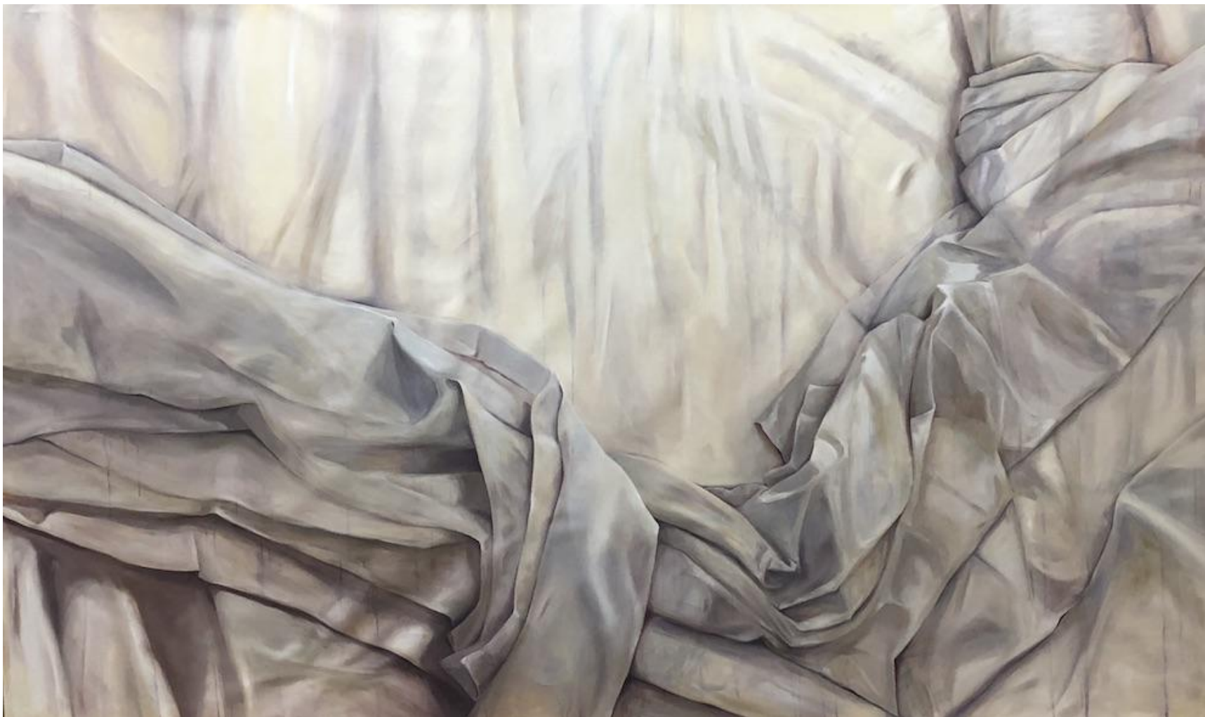
Liliana Alves, terceiro lençol , 2018, óleo sobre tela, 170 x 260 cm.