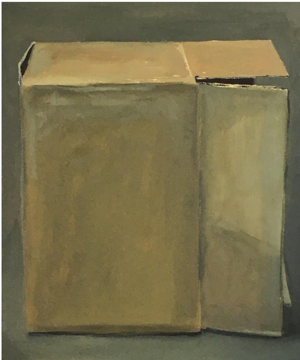
Liliana Alves, caixa de lado , 2017, óleo sobre cartão, 45 x 38 cm.