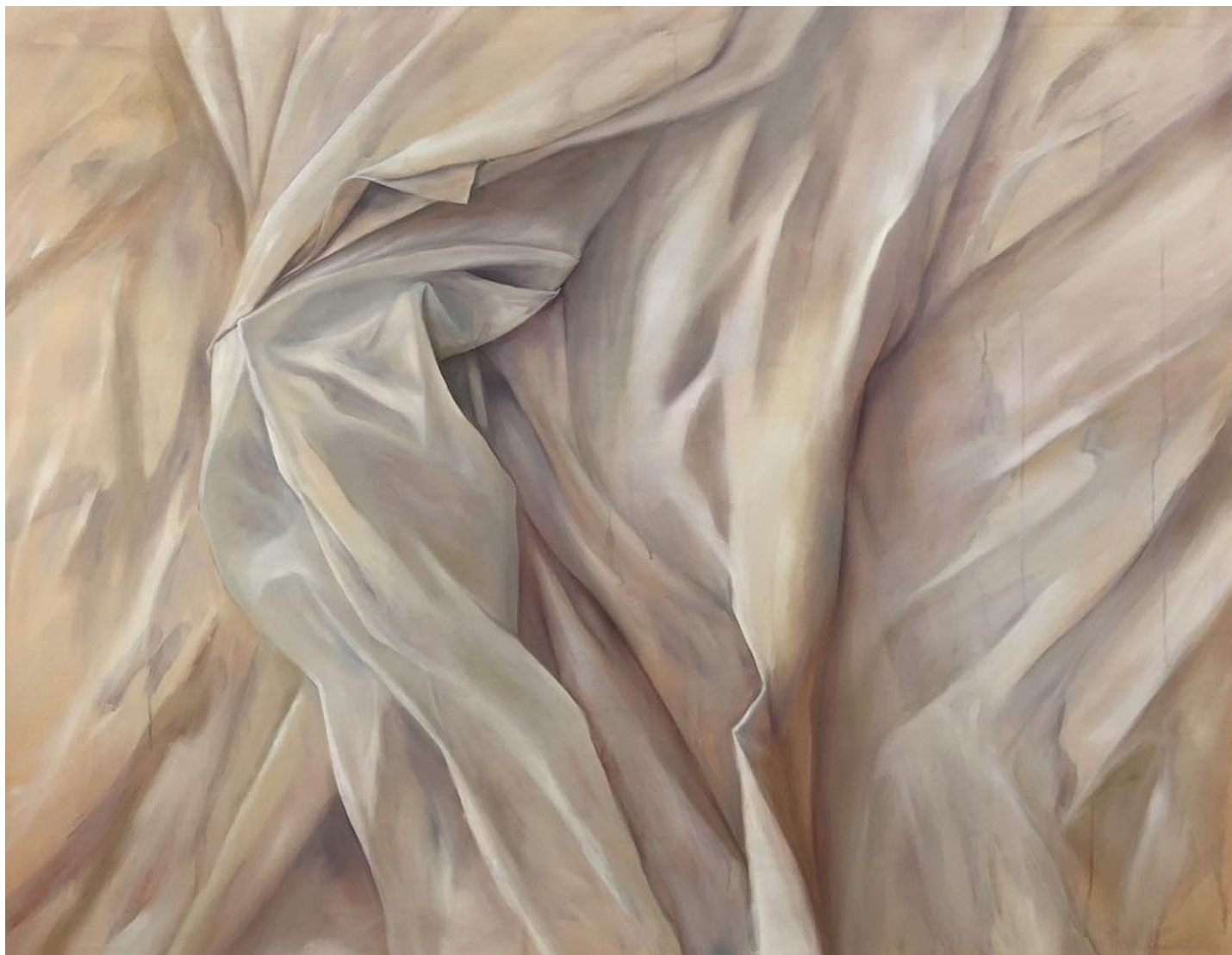
Liliana Alves, segundo lençol , 2018, óleo sobre tela, 125 x 150 cm.