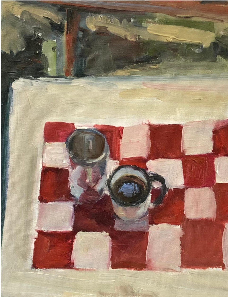
Liliana Alves, na memória , 2019, óleo sobre tela, 30 x 23,5 cm.