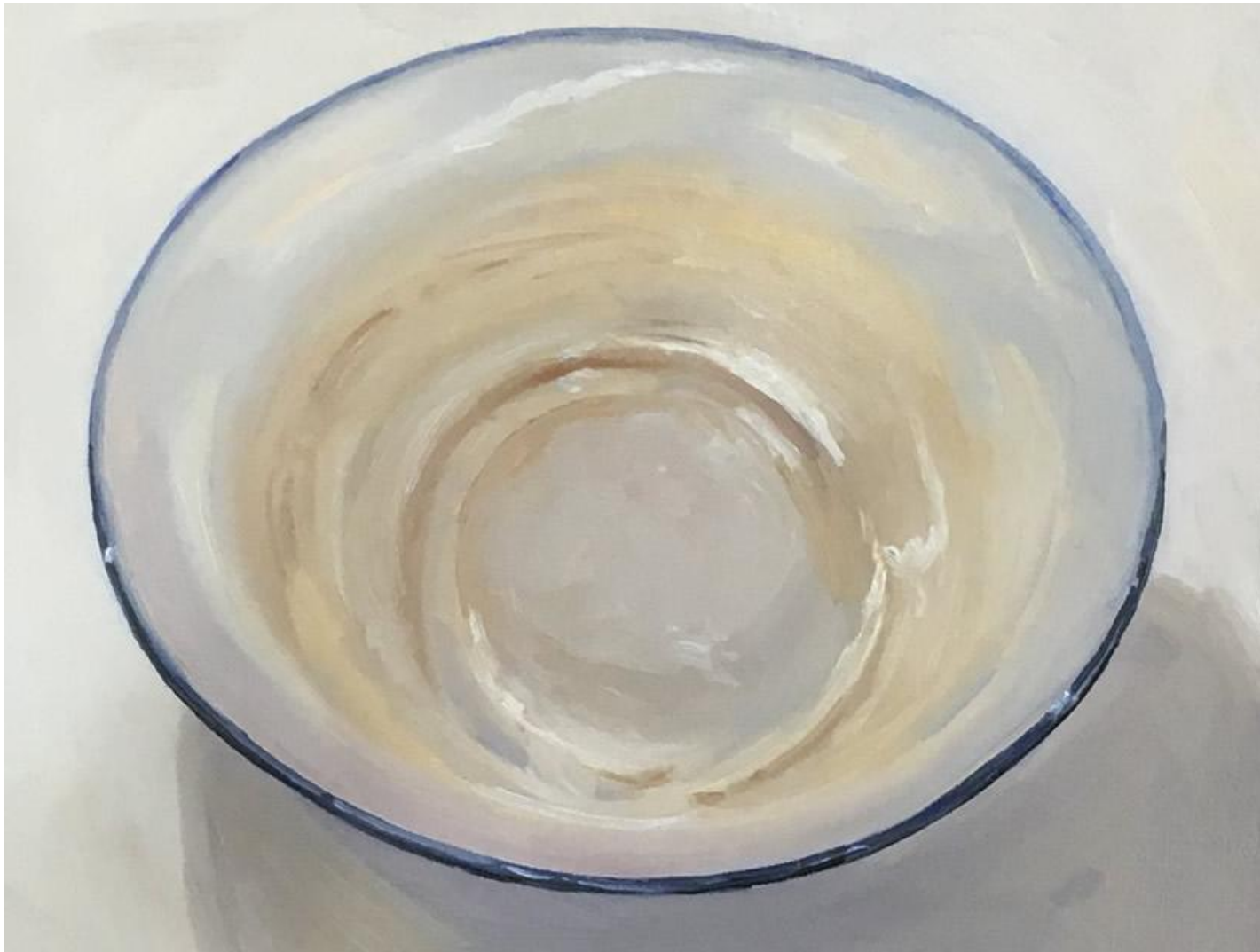
Liliana Alves, bacia de louça , 2016, óleo sobre papel, 27 x 31 cm.