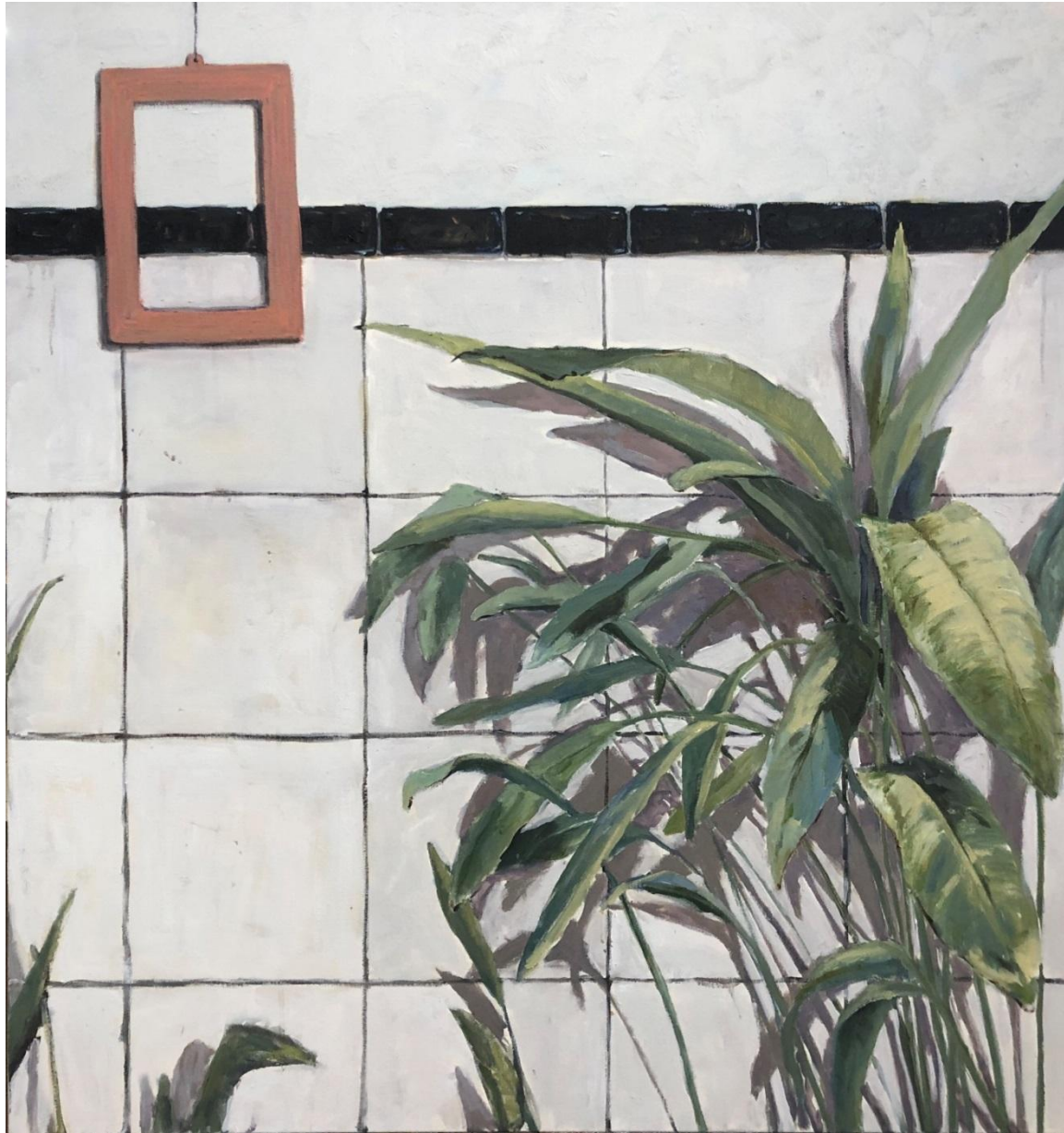
Liliana Alves, sem título , 2020, acrílico, óleo e cera sobre tela, 95 x 90 cm.