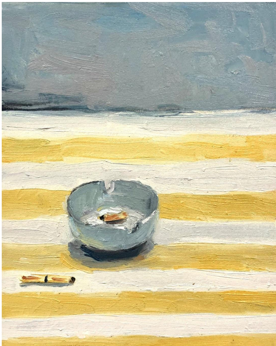
Liliana Alves, sem título , 2019, óleo sobre tela, 25 x 20 cm.