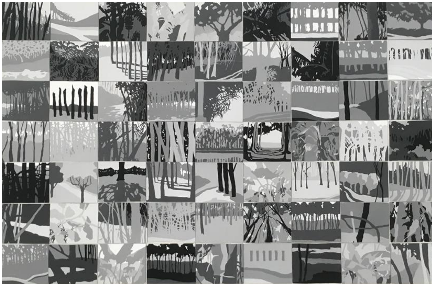
Liliana Alves, fragmentos da natureza , 2011, látex sobre cartão, 73 x 110 cm.